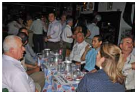
Los asistentes al evento tuvieron la oportunidad de relajarse después de las extensas jornadas del congreso, en la Fiesta ofrecida por ARP Colpatria