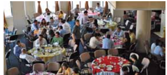
Almuerzo ofrecido por Andevip