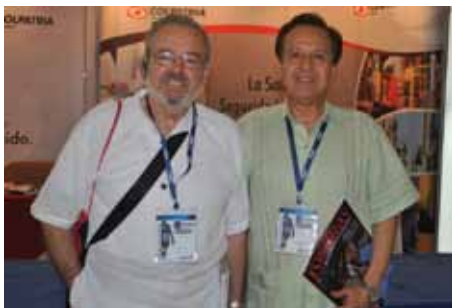
My. © German Duarte y My. © Orlando Sierra