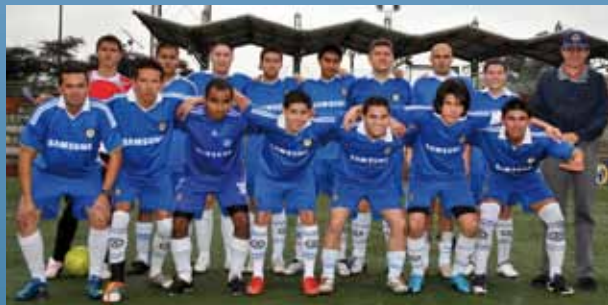
Sub Campeón: Autentica Seguridad