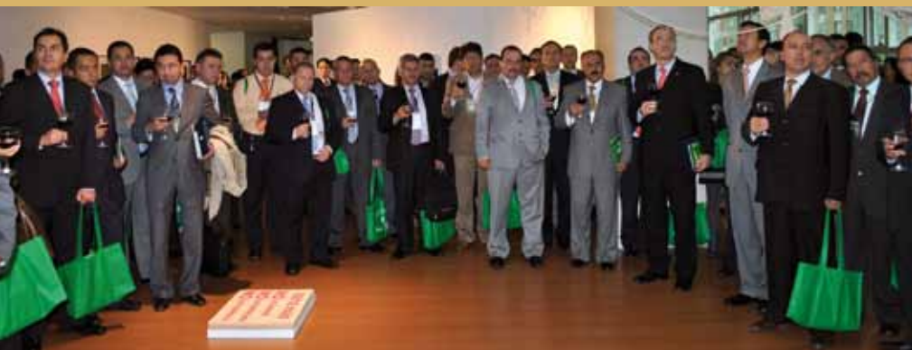
Los invitados especiales al brindis ofrecido al final del evento.