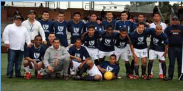
Campeón: Seguridad Superior

El tercer puesto fue para SERVISIÓN DE COLOMBIA.