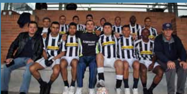
Tercer Puesto: Servision de Colombia