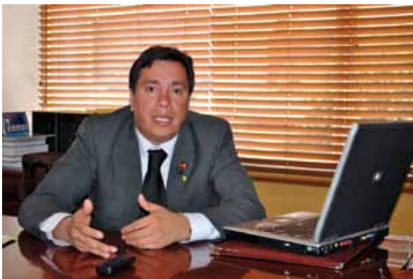
My © Gilberto Espitia - Orientación y Seguridad CTA

Oscar Javier López | Fotografía: Estrategas